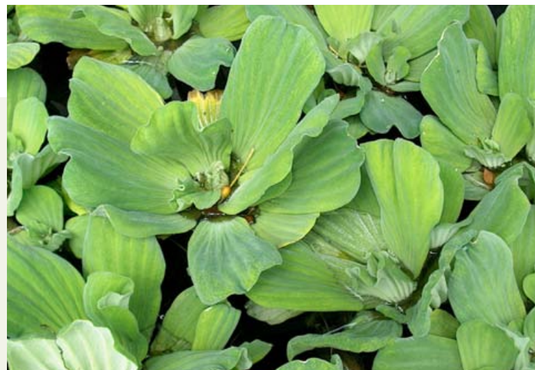
Des feuilles flottantes libres formant une rosette.