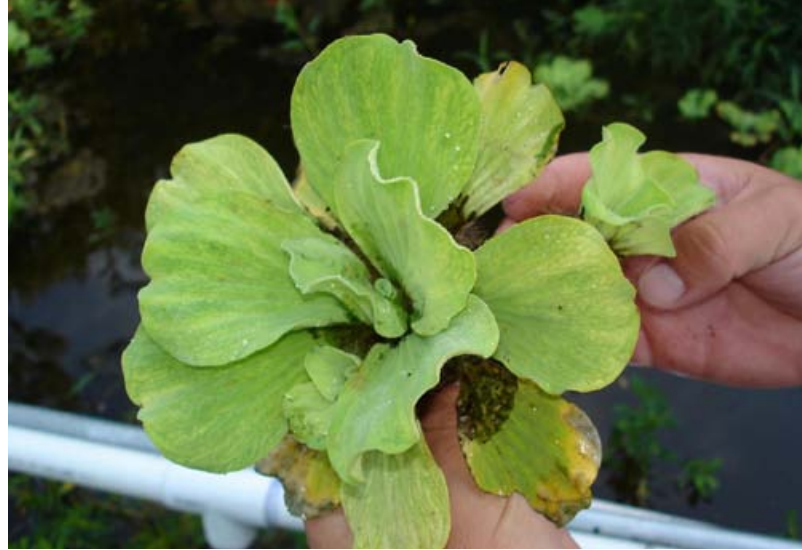
Rosette de laitue d'eau.

Téléphonez à la ligne d'assistance sur les espèces envahissantes au 1-800-563-7711.