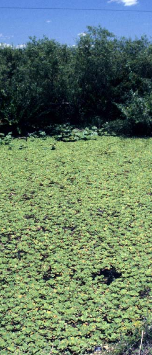
Tapis flottant libre de laitue d'eau.