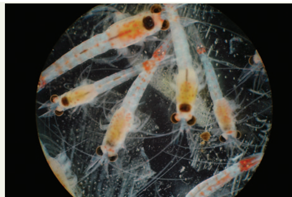
Regroupement de crevettes rouge sang.