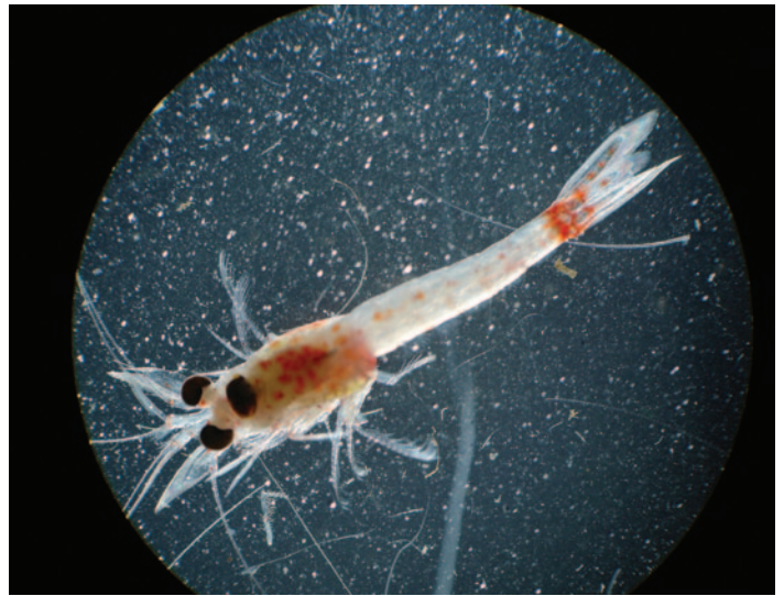
Des yeux proéminents et noirs, au bout de courtes tiges.

This publication is also available in English.