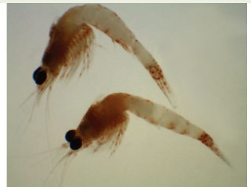
Crevette rouge sang mâle et femelle.

Les scientifiques ne comprennent pas toutes les répercussions de la crevette rouge sang sur les Grands Lacs, mais ils croient que ses habitudes alimentaires et