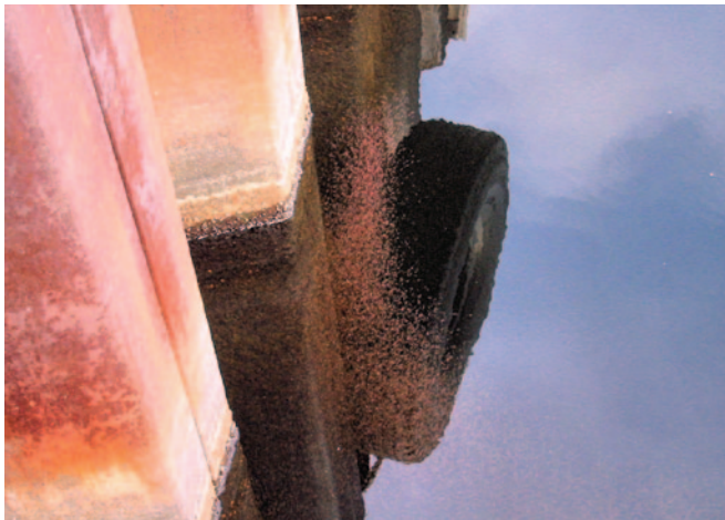
Essaim de crevettes rouge sang.

L'espèce indigène la crevette marsupiale (ou mysis, Mysis diluviana , autrefois M. relicta ) est très semblable, mais quand on l'examine à la loupe, sa queue est fourchue tandis que celle de la crevette rouge sang est carrée avec deux épines au bout.